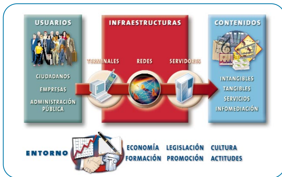
Figura 2: Modelo de la Sociedad de la Información.

Con la finalidad de delimitar cada uno de los elementos que configuran la Sociedad de la Información, a continuación se describe someramente cada uno de ellos: